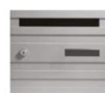
PORTE F ALU

Finition Traitement de surface par électrolyse, application de poudre Epoxy, gamme RAL au choix Gamme stratifiée au choix