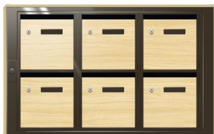
MODÈLE AMBRE BOÎTES AUX LETTRES NOUVELLES NORMES D'EXTERIEUR